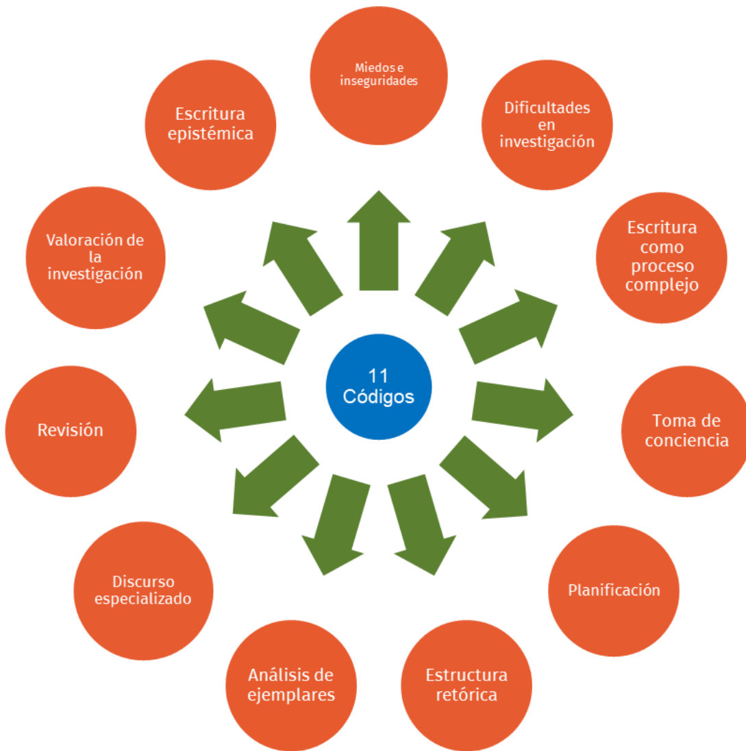
Figura 1. Percepciones codificadas

El resumen de los segmentos discursivos etiquetados en los estos códigos ha sido sistematizado en percepciones positivas y negativas en la siguiente tabla: